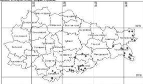
Рис. 1. Распределение колоний сурка степного в Курской области по результатам учетов в 2010 г.

Сурок степной (байбак) [ Marmota bobak (Müller, 1776)], или сурок обыкновенный – уязвимый вид, популяция которого в Курской области нестабильна (Жердева, 2005). В настоящее время численность сурка восстанавливается (рис. 1, табл. 1), но необходимы специальные меры охраны.