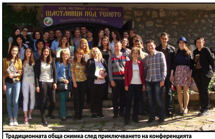
Традиционната обща снимка след приключването на конференцията

„Научният форум е една прекрасна възможност и предизвикателство за нас, дава ни шанс да избягаме от рутината и да се потопим изцяло в света на науката, където времето не тече по същия начин – превръщаме се в част от безкрайността“ – коментира носителката на първа