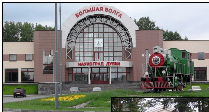
Гарата на Дубна (горе) и Главният административен център на ОИЯИ

Значителни успехи ОИЯИ бележи в теорията и експери-