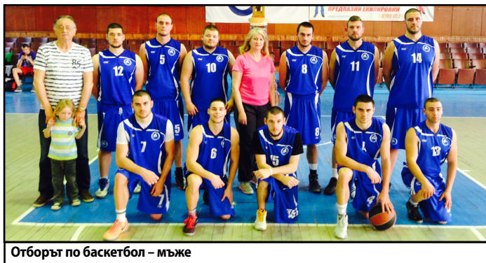
Отборът по баскетбол – мъже