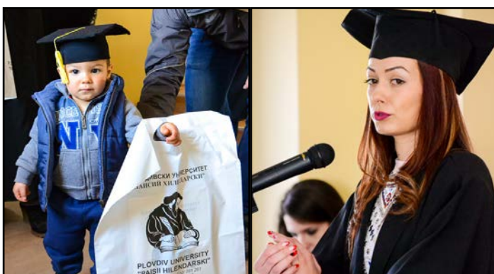
Две поколения студенти в университета