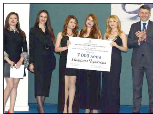
Официалната церемония по награждаването

Второ място, подплатено с парична премия от 4000 лв., зае първокурсникът по софтуерно инженерство в Пловдивския университет Нико-