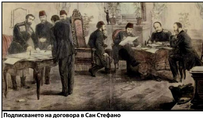
Подписването на договора в Сан Стефано

и народи знаят какво правят в собствената си държава за своята нация! Или има някакво друго мнение по този въпрос?