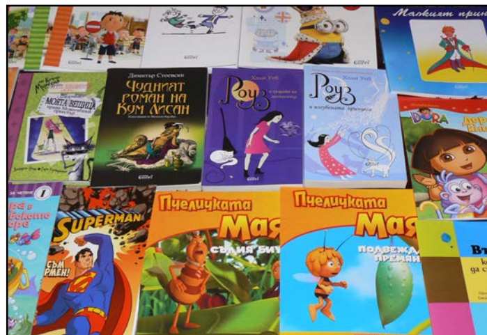
Част от дарените детски книжки

Книги и медикаменти за пациентите от Детското онкохематологично отделение в Клиниката по педиатрия и генетични заболявания на УМБАЛ „Свети Георги“ осигури благотворителната инициатива „Ola Española“ на студенти от Пловдивския университет „Паисий Хилендарски“, които изучават испански език. Към тях се присъединиха лингвисти и почитатели на езика и културата на Кралство Испания.