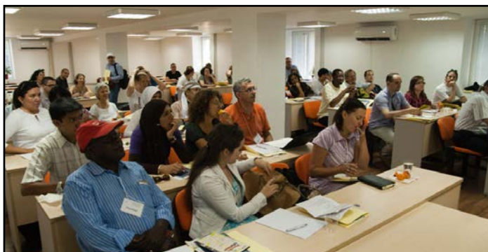
Участници в Балканското лятно училище

Третото Балканско лятно училище е на тема Stranger and Neighbor и ще фокусира вниманието върху проблемите, възникващи във връзка с миграцията и религиозните аспекти на срещата между „свои“ и „чужди“ в сложните условия на днешния свят. То ще се проведе в периода 2 – 12 юли 2017 г. с участници от Европа, Азия, Африка и САЩ. Кандидатите от България трябва да бъдат на възраст над 30 години, да владеят английски език и да са мотивирани за участие в подобен проект. Сроктът за подаване на документите е 15 март 2017 г. Организаторите покриват разходите по настаняване и