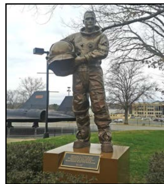
Астронавт в Музея на космонавтиката в Хънтсвил

Докато „знаменитите“ космически предприемачи като Елон Мъск и Пол Алън действително се радват на голяма популярност, „малките“ космически предприемачи са почти игнорирани от социалните учени и изследователите на космическата политика, като