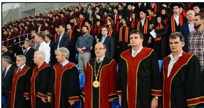
Факултет по математика и информатика