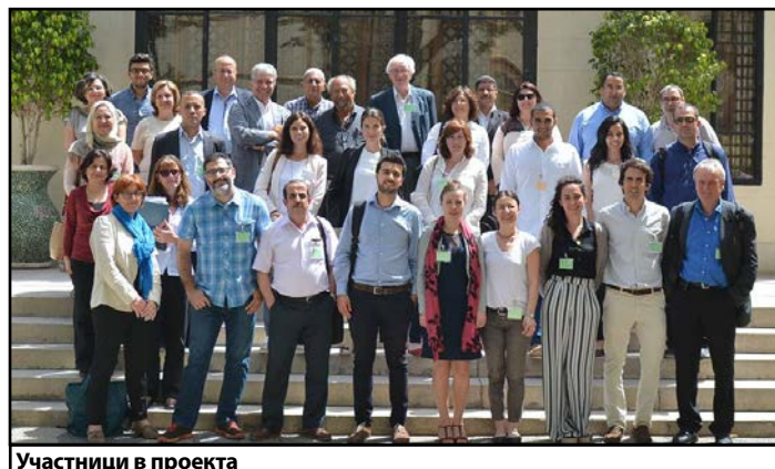
Участници в проекта