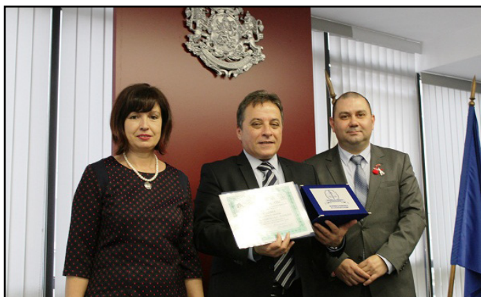
Моменти от честването на кръглата годишнина

Сътрудничеството в редица направления между Адми-