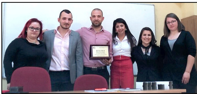
Ръководството на Студентския съвет през изтеклия мандат

На 29.03.2017 г. в 6-а аудитория бе свикано Общото събрание на Студентския съвет, на което беше отчетена дейността на ръководството за изминалия мандат и беше избран нов председател. За първи път в истори-