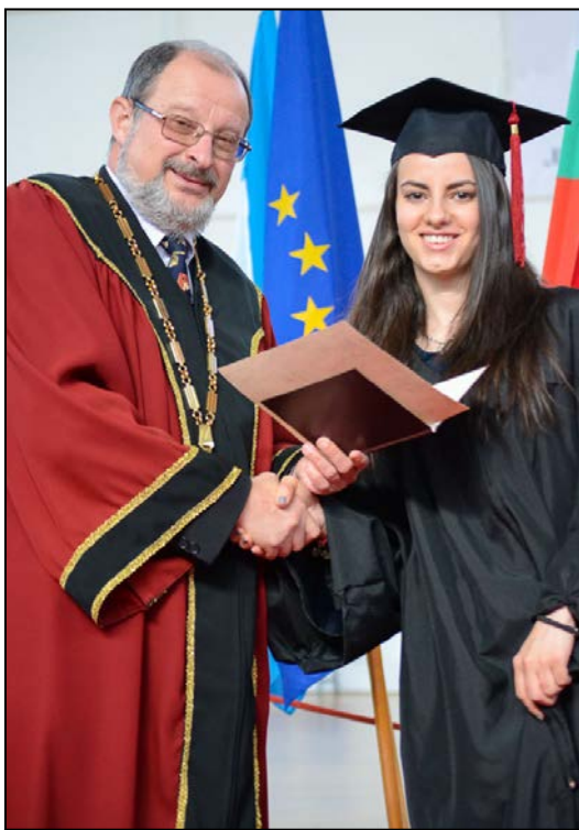
Ректорът връчва дипломата на една от отличничките

нямаше да бъдете същите; за лишениите и отказа им от собствените им нужди и мечти, за да имате вие своите; за трепета на днешния ден, заради който те са приели дори да изглеждат необичайно официални – заради големия ваш ден; за това, че днес вие празнувате, а вие сте смисълът на техния живот. Не забравяйте, че не са много народите, убедени, че образоваността на децата е първата, най-дълбоката и безспорно заслужаваща си жертва, която те ще направят безапелационно. Не са много хората, които до такава степен ценят мечтите на младостта и тяхната