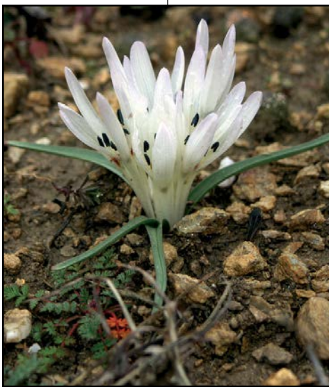
Рядката атинска мерендера ( Merendera attica ) цъфти още през януари – февруари