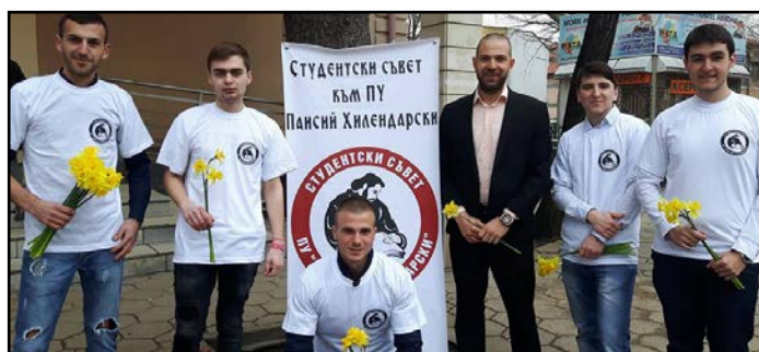
Момчетата от Студентския съвет са готови да поднесат цветя на дамите за 8 март

На 8.03.2017 г. Пловдивският университет „пожълтя“. Наричахме тази инициатива така, защото момчетата от Студентския съвет направиха специален жест към всички дами от университета по случай Международния ден на жената. През целия ден се раздаваха жълти нарциси, което повдигна празничното настроение и предизвика искрените усмивки на дамите.