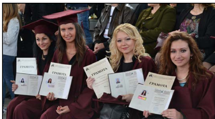
Факултет по икономически и социални науки