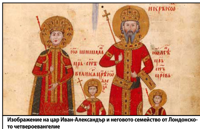
Изображение на цар Иван-Александър и неговото семейство от Лондонското четвороевангелие

Резултатът не закъснял – новата царица, като всяка майка, искала да обезпечи трона за своите снове. Затова се обръща към изпитаната ромейска практика на „багренородството“. Провъзгласяването на първородния ѝ син – Иван Шишман, за „млад цар“ към 1356 г. довело до открит разрыв между цар Иван-Александър и сина му Иван-Страцимир, който не закъснял да се провъзгласи за „цар на българи и гърци“, с което открито демонстрирал, че не зачита бащината воля.