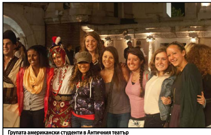
Групата американски студенти в Античния театър

С помощта на моята приемна мама напирах пулса на българската култура. За първи път непознатото не предизвикваше у мен чисто въодушевление. Аз изведнъж почувствах плахост. Тази култура не е нещо, което мога да взема с лека ръка. Историята на българите е реална и несравнимо красива. Ние сме свидетели на плодовете на това общество. Почувствах се смирена, когато осъзнах себе си като гост.