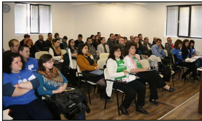
Работен момент от конференцията

За пореден път ученици взеха участие в конкурса за научен проект „Еврика“, където младите любители на науката трябваше да представят по увлекателен начин свои иновативни идеи или научноизследователски проекти, по които работят в екип или самостоятелно. Те демонстрираха по един по-различен начин интересни разработки, лабораторни