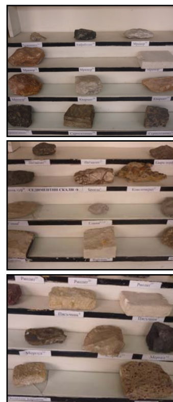
Част от петрографската колекция

Катедра „Екология и опазване на околната среда“