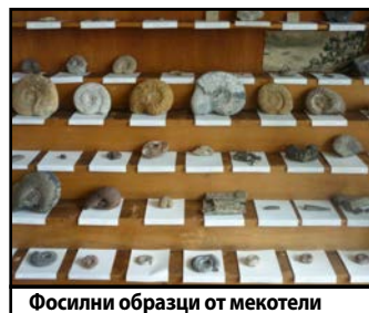
Фосилни образци от мекотели

ния, тъй като са съществували през цялата история на живота върху Земята.