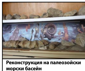
Реконструкция на палеозойски морски басейн