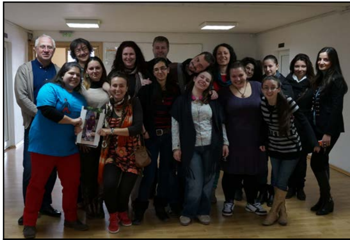
Екипът, който реализира проекта „Усети града“

Денят продължи с интерактивния маршрут „Усети града“, който е резултат от едноименния студентски проект, реализиран през 2014 година от АКЕА „Медиатор“ и екип от студенти и преподаватели към Философско-историческия факултет на ПУ „Паисий Хилендарски“. Маршрутът насочва вниманието към различни интерпретации на градското пространство, като съчетава дейности, които биха могли да помогнат да се видят централните пространства на Пловдив по друг начин. Интерактивният маршрут дава възможност за емпатийно поставяне на мястото на хора със зрителни увреждания – чрез него ние попаднахме в друг свят, в който замъглените или липсващите визуални образи са компенсирани и заменени от множество сетивни възприятия. Ако подобно предизвика-