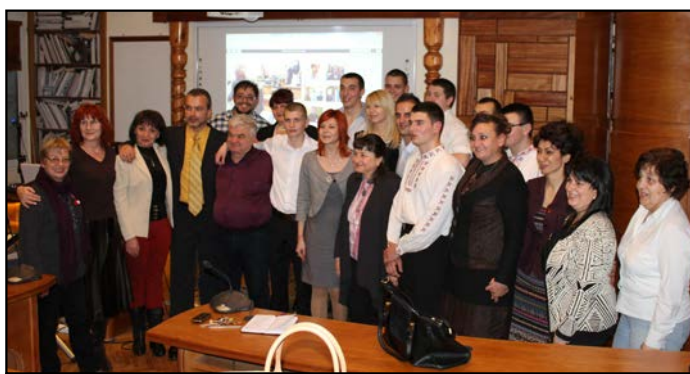
Обща снимка на участниците в уебинара

Участниците осъществиха онлайн връзка от уебинарната зала на Университета с кавалджии от България, САЩ, ЮАР, Македония, Сърбия,