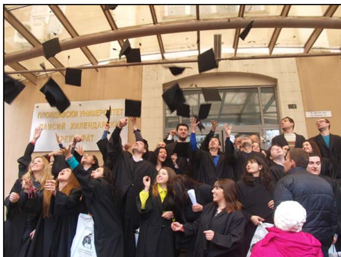
Щастливите absolventи от Физическия факултет