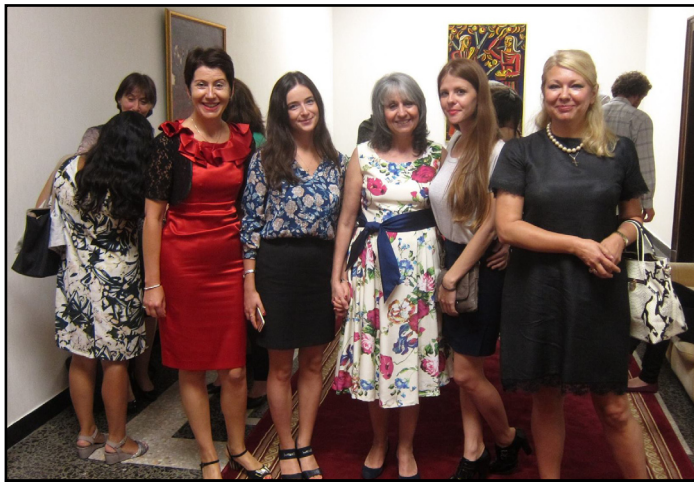
Участници в проекта заедно с вицепрезидента на Република България г-жа Маргарита Попова

Да се изгради ефективен мост на сътрудничество между европейската българистика, българските културни центрове и българския туристически бизнес – това беше амбициозната цел, която си поставиха участниците в проекта „Живописна България. Български литературни маршрути“. За неговата реализация бе заложено на работещата система от лекторати към Министерството на образованието и науката в европейски страни, като: Австрия, Германия, Гърция, Франция, Полша, Украйна, Русия, както и на сътрудничеството и участието на преподаватели от Пловдивския и Софийския университет. Задачата бе с помощта на литературните текстове (на автори като Яворов, Йовков, Радичков..., Г. Господинов, Т. Димова и т.н.) да се създаде за чуждестранните читатели/посетители/туристи атлас на провокативно интересната,