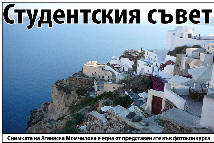
Снимката на Атанаска Момчилова е една от представените във фотоконкурса