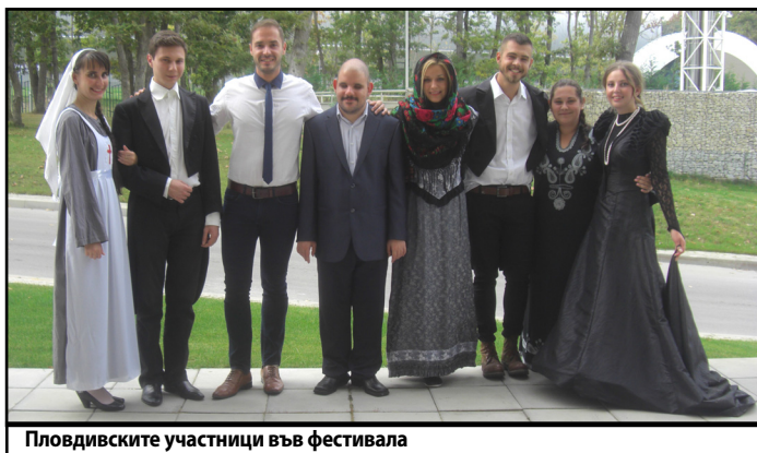
Пловдивските участници във фестивала

След тържественото откриване на фестивала участниците направиха виртуална разходка