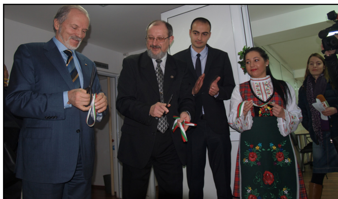
Технологичният център на Пловдивския университет започна своя официален път със символичното прерязване на лентата преди една година